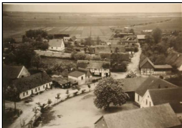
Abb. 3: Blick auf Dünnow vom Kirchturm