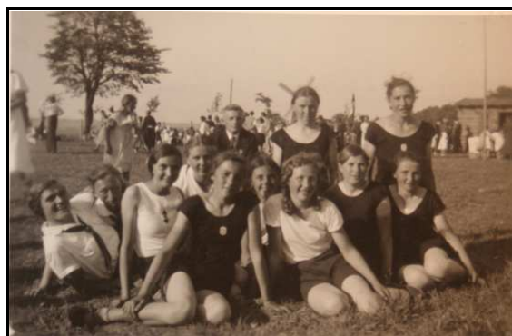
Abb. 4: Beim Sportfest, ca. 1938

geb. 29.4.1739 in Schwolow. Get. 1.5.1739 gest.?